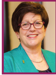
폴린 그린 Pauline Green 국제협동조합연맹(ICA) 회장

국제협동조합연맹(ICA)은 협동조합운동의 가치와 원칙을 담고 있는 <협동조합 정체성 선언문>의 글로벌 수호자이며, 협동조합기업의 토대가 되는 협동조합 7원칙이 제대로 해석되게 할 책임이 있습니다. 이러한 점을 고려하면 이 안내서는 다소 늦은 감이 있습니다.