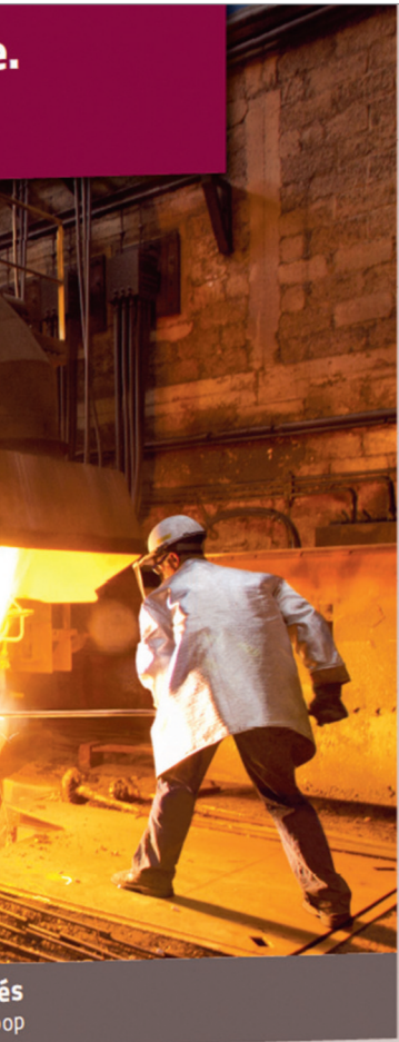
Acidités de l'acier, pièces d'acier moulées. www.ap-ind.fr